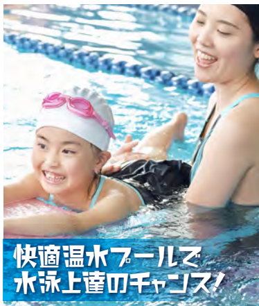
快適温水プールで 水泳上達のチャンス!